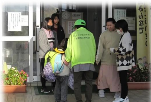
毎朝の様子。ボランティアさんと総務委員に感謝です。

そこで、日中の「こんにちは」を盛んに呼び掛けています。大人で言えば、すれ違いざまの「お疲れ様！」です。随分、気持ちも乗ってきた子供たちは、気持ちよく「こんにちは！」と声を返します。「こんにちは」に至ってはほぼ満点。1、2年生は、すれ違いざまにこちらが言う前に言ってきます。そのおかげか、来校者への挨拶も一段と良くなりお褒めの言葉をいただくこともしばしばです。大人も子供もニコニコ笑って一日過ごせる、そんな学校でありたいと思います。